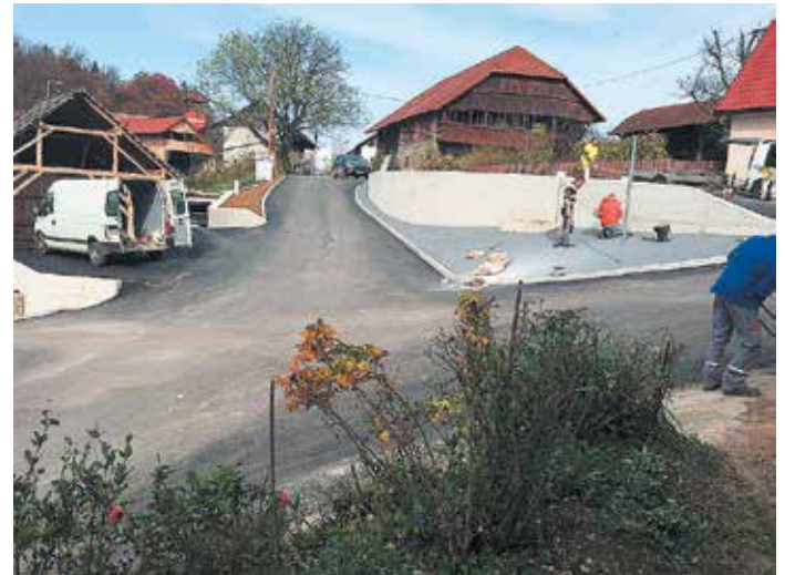
Obnovljeno in povsem preurejeno križišče na Belem griču v katerem velja tudi povsem nov prometni režim.