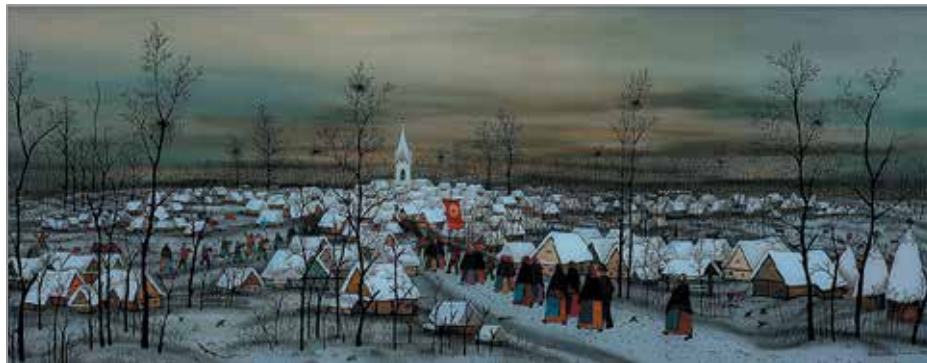
IVAN LACKOVIČ, Dva svetova, 1969, 40 cm x 100 cm, olje na steklu, inv. št. GT26

Z besedo predaja človek človeku svoje misli, z umetnostjo pa ljudje drug drugemu predajajo svoja čustva.